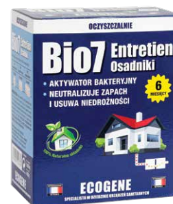
Bio7 Entretien Osadniki Codzienna eksploatacja Kod Bio7-22987