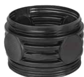
Nadbudowa zbiornika gwintowana D400 H250 Kod W-004G

Bio7 | biopreparaty dla użytkowników przydomowych oczyszczalni ścieków