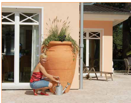
Zbiornik na wodę Antyczna Amfora