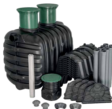
Przykładowy zestaw epurbio z tunelami rozszczajającymi