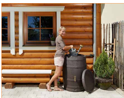
Zbiornik na wodę Barrica