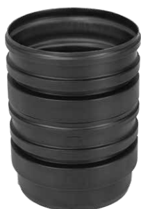
Nadbudowa zbiornika teleskopowa D400 H500 Kod 330341