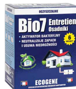
Bio7 Entretien Osadniki Codzienna eksploatacja Kod Bio7-22987

Bio7 | biopreparaty dla użytkowników przydomowych oczyszczalni ścieków