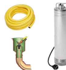
Zestaw Ogród Komfort Promo