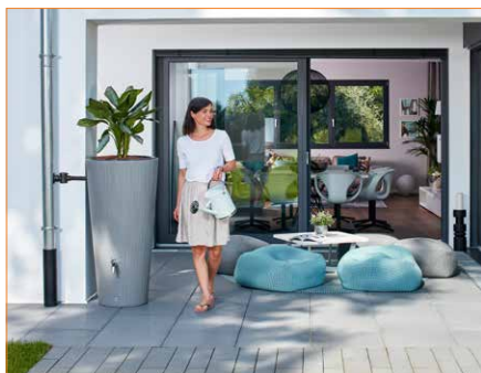
Zbiornik na wodę Linus 2w1