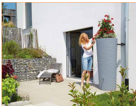
Zbiornik na wodę Natura 2w1