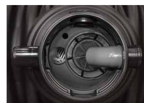
Zestaw Ogród Basic Promo