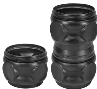
Nadbudowa studzienki D300 H250 / D300 H600 Kod W-014 T / W-015 T