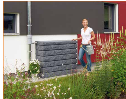
Zbiornik na wodę Rocky