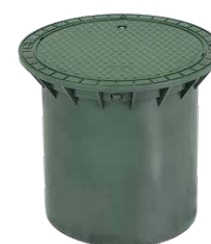
Pokrywa teleskopowa D400 H500 Kod 340053