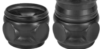
Nadbudowa studzienki D300 H250 / D300 H600 Kod W-014 T / W-015 T