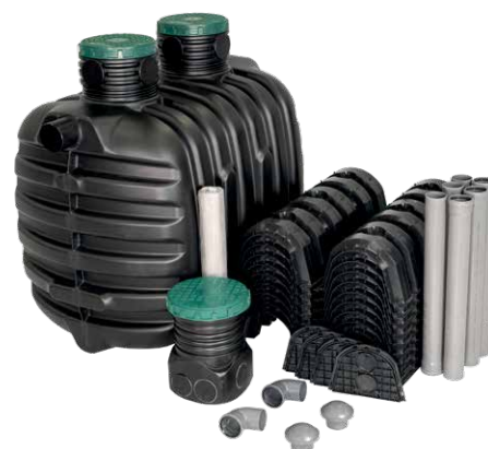
Przykładowy zestaw epureco z komorami rozsączającymi