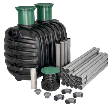
Przykładowy zestaw epurbio z drenażem rozszczajającym