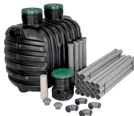
Przykładowy zestaw epureco z drenażem rozsączającym