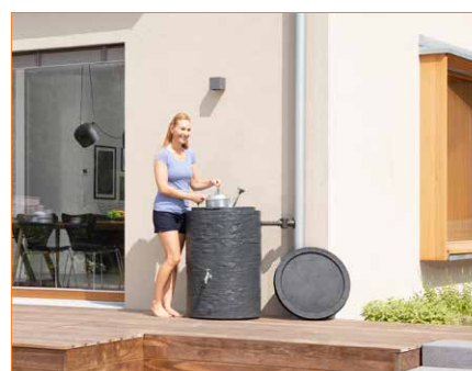
Zbiornik na wodę Muro